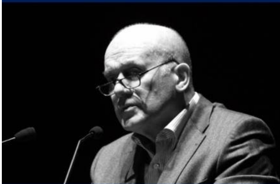
BRIGITTE PFEIFFER © DFG

Mit Zischler als Rezitator der Texte von Leonard Cohen präsentieren wir einen kongenialen Interpreten der Wortkunst des kanadisch-jüdischen Songschreibers. Der Berliner „Tagesspiegel“ würdigte Zischler zu dessen 70. Geburtstag (18. Juni 2017) als den „höchstwahrscheinlich klügsten Schauspieler Deutschlands“.